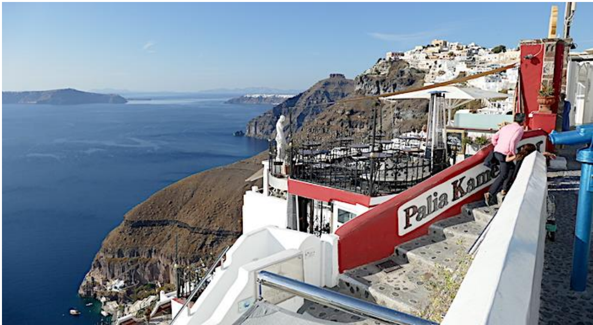
Super Kulisse am Kraterrand: Blick von Thira nach Firostefáni . Unten links der Alte Hafen, hinten Mitte Oia.