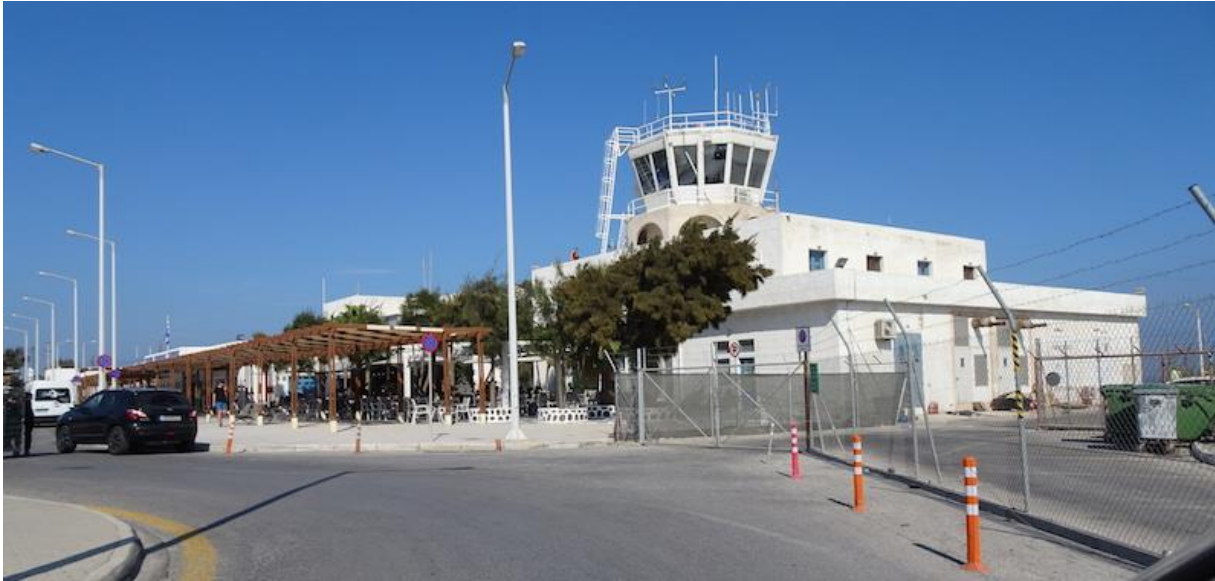
An der Westküste der Insel, der Santorini Flughafen .