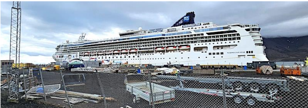
Morgens 7:30 Uhr: mein Schiff, die NCL Star am Kai.