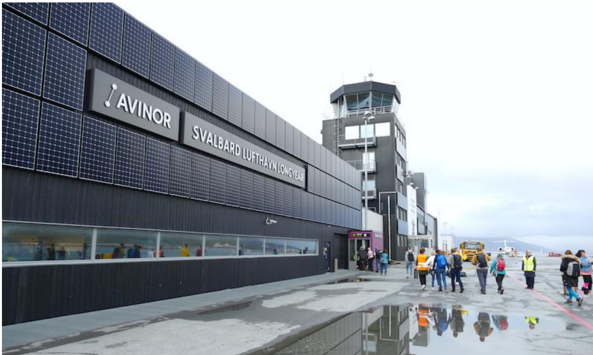
Moderner Ankunftsterminal: Svalbard Airport