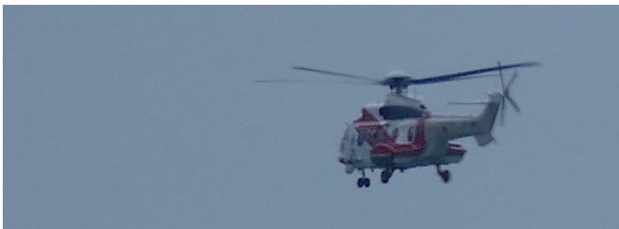
In Siedlungen ohne Air Strip: Hubschrauber

Alternative sind die sehr teuren Taxis . Sie warten ebenfalls vor dem Airport und sind sinnvoll, wer sich z.B. zu vielen das Taxi teilen kann – und für weit abgelegene Hotels.