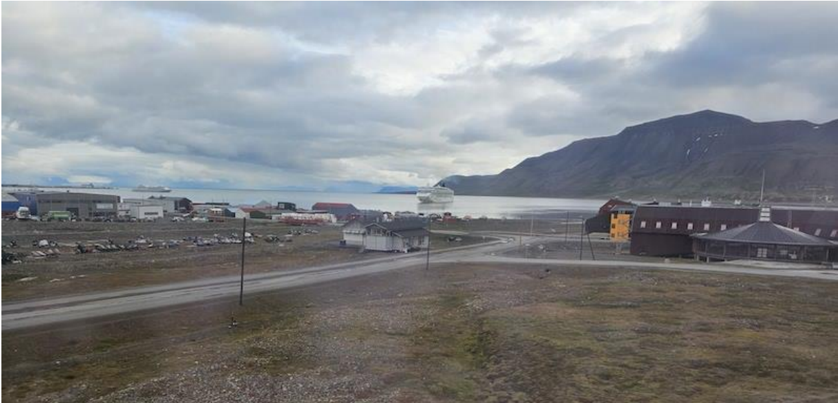
Morgens 6 Uhr früh: mein Schiff, die NCL Star kommt.