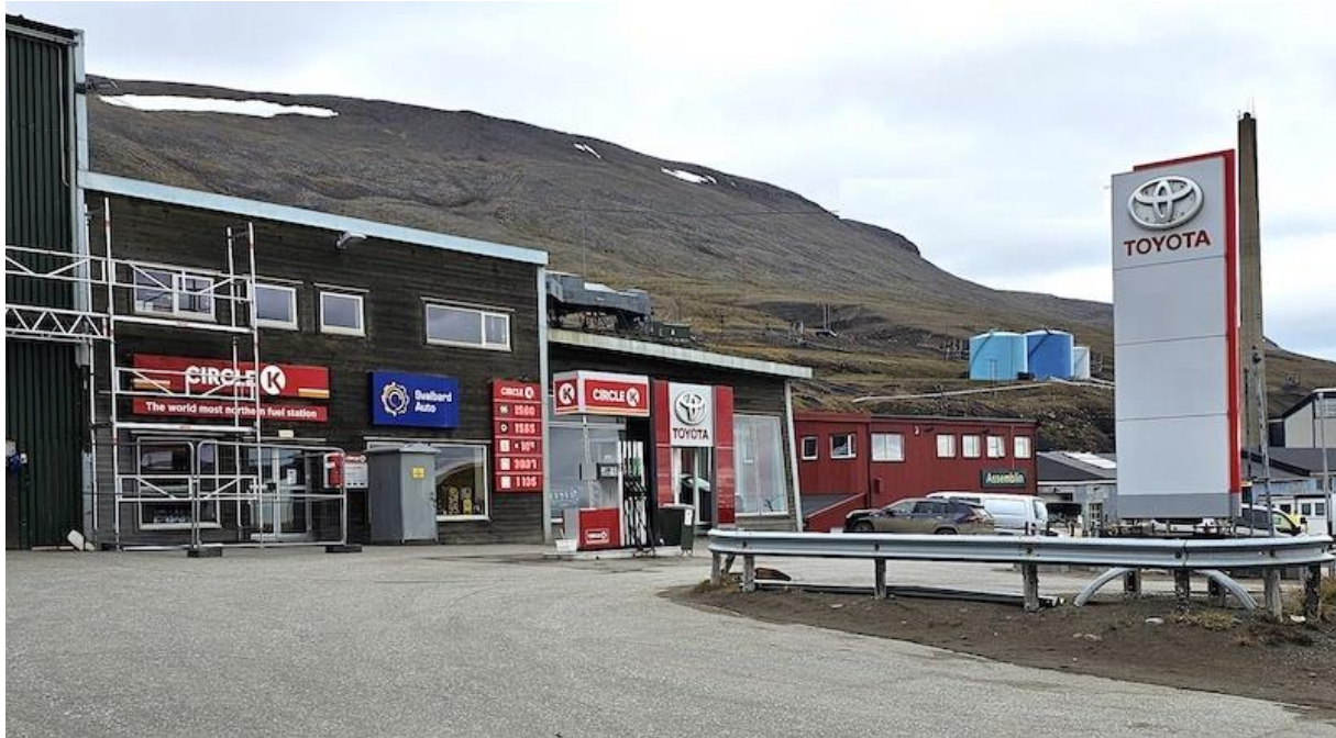
High Light: nördlichste Tankstelle der Welt.