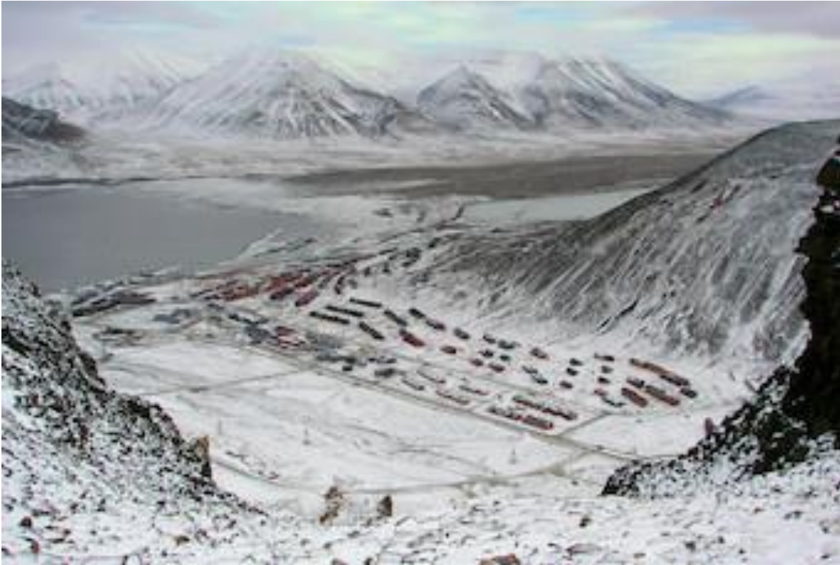
Longyearbyen im Winter.