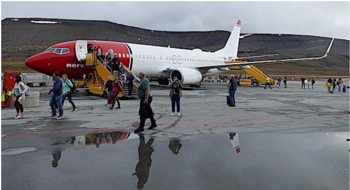
Es fliegen Norwegian und SAS: Svalbard Airport