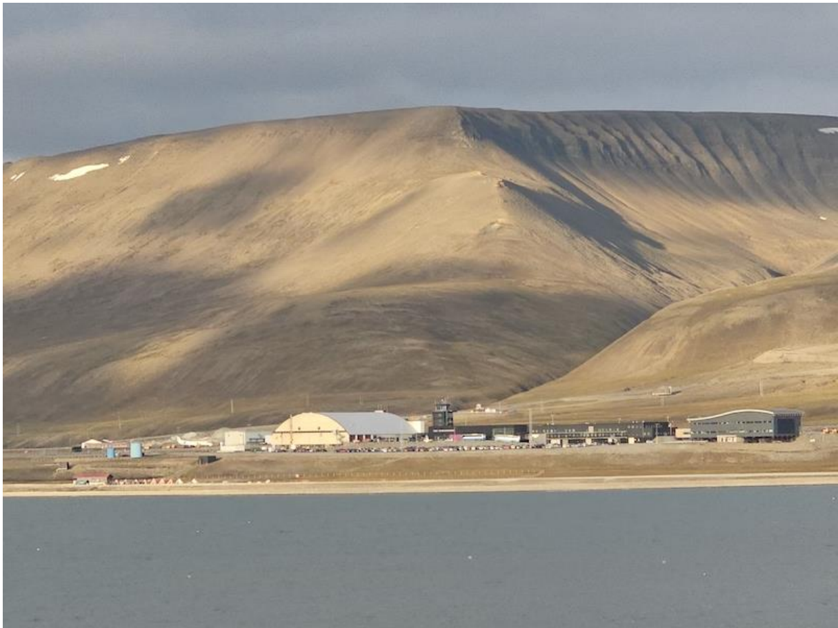
LI.: Lager/Service Halle und RE. (schwarz) der Tower und das Empfangsgebäude: Svalbard Airport