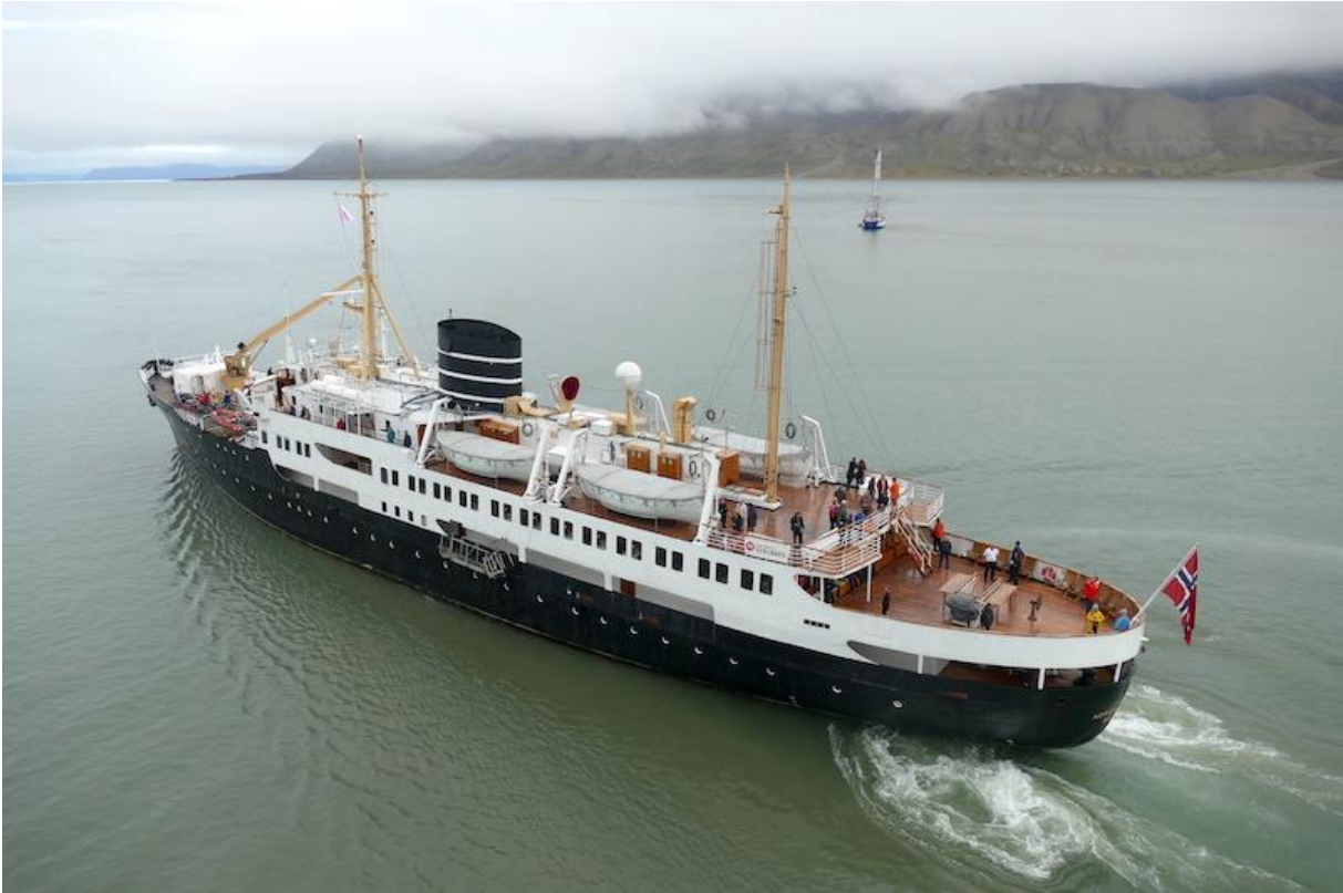
Wunderschöner Oldie: die MS Nordsternen der Hurtigruten.